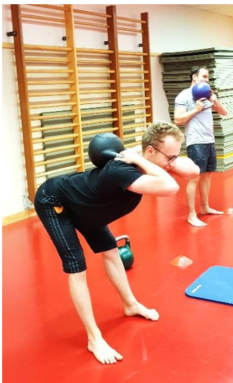
Energieverbrauch kcal, während einer 30 minütigen Trainingseinheit